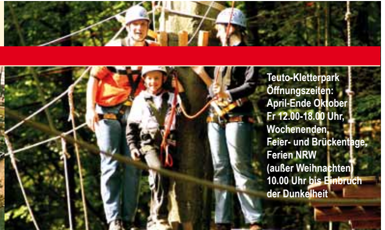
Teuto-Kletterpark Öffnungszeiten: April-Ende Oktober Fr 12.00-18.00 Uhr, Wochenenden, Feier- und Brückentage, Ferien NRW (außer Weihnachten) 10.00 Uhr bis Einbruch der Dunkelheit

12 Vor dem Ampelüberweg gehen wir links ein paar Schritte in die „Paulinenstraße“, um neben dem Altenheim, auf dem ehemaligen Weinbergfriedhof, einen Moment an den Gräbern von C. D. Grabbe und seiner Mutter zu verweilen. Zurück zur Ampel überqueren wir die „Paulinenstraße“ und gehen am ehemaligen „Hornschen Tor“ in die Fußgängerzone. Interessant sind die hübschen alten Giebel auf beiden Straßenseiten. Besonders auffallend auf der linken Seite das Schmerimenhäuser (Nr. 14) mit einzigartiger Sandsteinfassade von 1587 im Stil der Weserrenaissance. Es lohnt sich, von hier aus einen Blick in die idyllische „Auguststraße“ zu werfen.