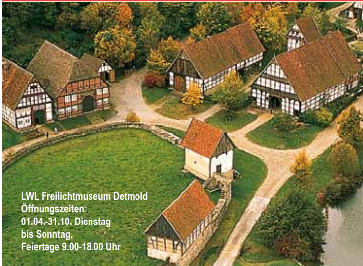
LWL Freilichtmuseum Detmold Öffnungszeiten: 01.04.-31.10. Dienstag bis Sonntag, Feiertage 9.00-18.00 Uhr