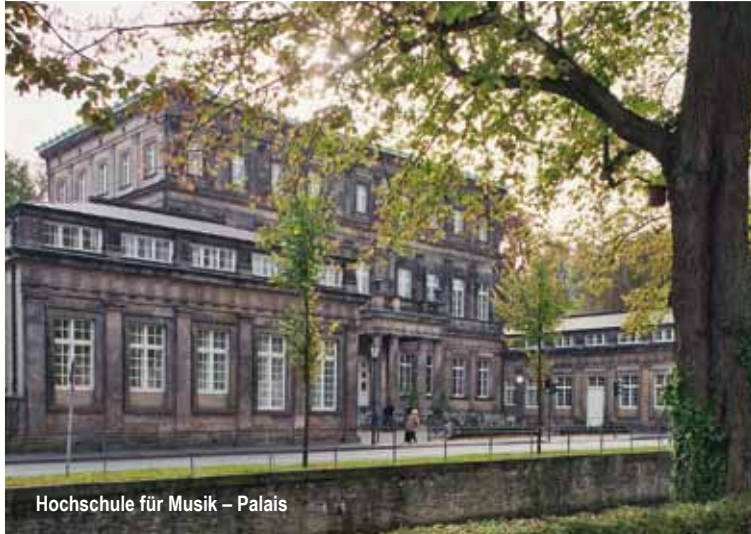
Hochschule für Musik – Palais

Vom „Wall“ führt der Weg nach links in die „Freiligrathstraße“, benannt nach dem 1810 in Detmold geborenen Dichter Ferdinand Freiligrath, einem der bedeutendsten Söhne der Stadt. Er starb 1876 in Cannstatt.