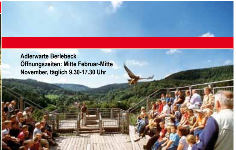
Adlerwarte Berlebeck Öffnungszeiten: Mitte Februar-Mitte November, täglich 9.30-17.30 Uhr