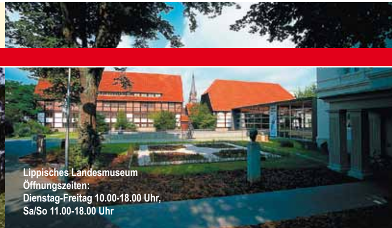
Lippisches Landesmuseum Öffnungszeiten: Dienstag-Freitag 10.00-18.00 Uhr, Sa/So 11.00-18.00 Uhr