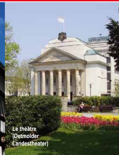
Le théâtre (Detmolder Landestheater)

Au départ de la Maison du Tourisme de Detmold, ce circuit vous guide dans les rues chargées d'histoire et vous présente les monuments historiques de Detmold ancienne résidence princière.