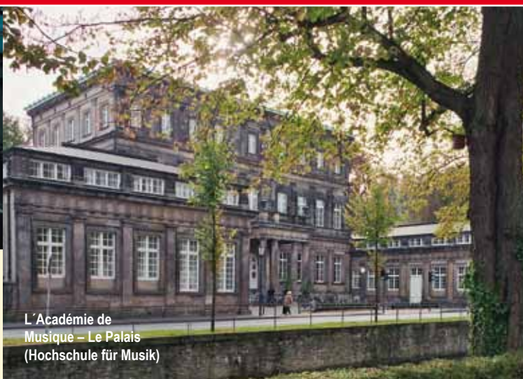
L'Académie de Musique – Le Palais (Hochschule für Musik)

5 Vous êtes à présent dans la rue qui porte le nom de «Lortzingstraße». A votre droite il y a une plaque commémorative pour l'ancienne synagogue qui a été détruite en 1938 pendant la Nuit de Cristal.