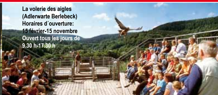
La volerie des aigles (Adlerwarte Berlebeck) Horaires d'ouverture: 15 février-15 novembre Ouvert tous les jours de 9.30 h-17.30 h

8 Vous vous dirigez alors vers la gauche pour découvrir au bout une ruelle portant le nom de «Unter der Wehme». Au n° 5 à votre gauche, la maison où est né en 1801 le poète Christian Grabbe. Cette maison servait à l'époque de prison. Au n° 7, la maison où il est décédé en 1836. De l'autre côté vous franchissez une porte en fer forgé pour contourner le bâtiment de l'ancien «Landessuperintendentur» qui vous ramène ensuite à la place du marché.