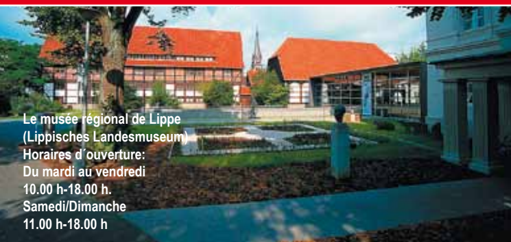
Le musée régional de Lippe (Lippisches Landesmuseum) Horaires d'ouverture: Du mardi au vendredi 10.00 h-18.00 h. Samedi/Dimanche 11.00 h-18.00 h