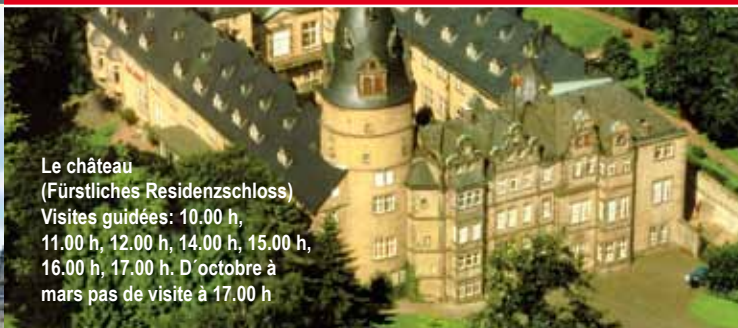
Le château (Fürstliches Residenzschloss) Visites guidées: 10.00 h, 11.00 h, 12.00 h, 14.00 h, 15.00 h, 16.00 h, 17.00 h. D'octobre à mars pas de visite à 17.00 h